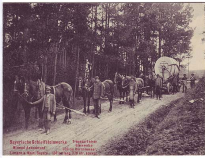
Bayerische Schleifsteinwerke Transport einer Michael Ankenbrand Steinwalze Eltmann a. Main, Bayern 180 cm lang, 270 Ctr. schwer