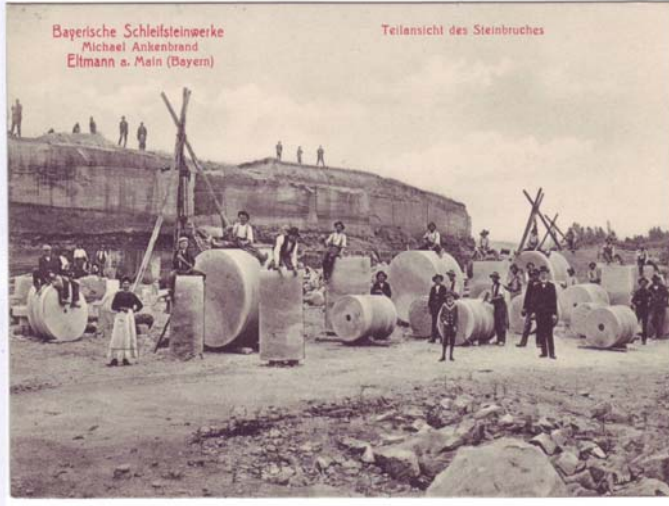
Bayerische Schleifsteinwerke Michael Ankenbrand Eltmann a. Main (Bayern)