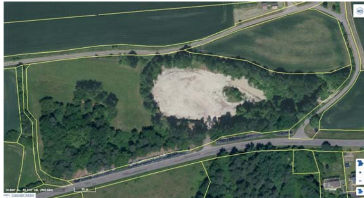
Der Kellerbruch vor Breitbrunn direkt an der Staatsstraße 2274