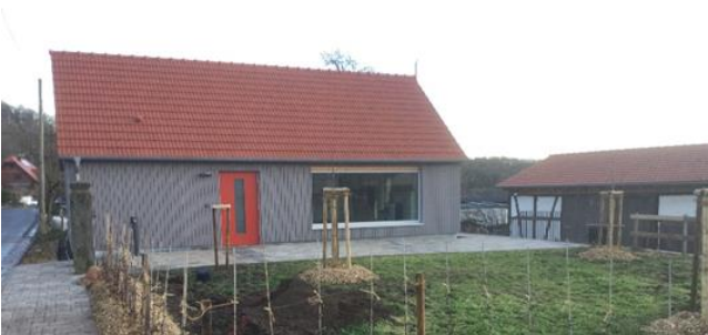
Das Dorfgemeinschaftshaus Rottenstein ist ein Ort der Begegnung.

Mit einer feierlichen Veranstaltung wurde am 11. April 2026 das Dorfgemeinschaftshaus Rottenstein eröffnet. Das über LEADER geförderte Projekt umfasst die Ausstattung des Innen- und Außenbereichs, die Öffentlichkeitsarbeit sowie die Untersuchung des im Ort