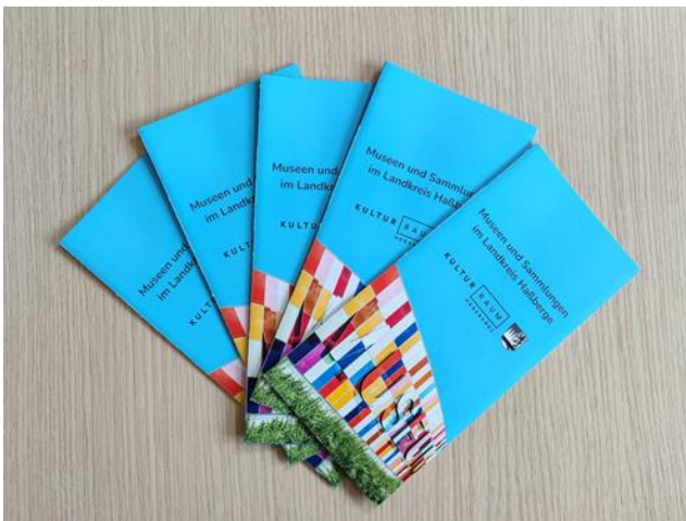
Das neue Museumsfaltblatt.

Im Februar veröffentlichte die Kulturstelle ein vollkommen überarbeitetes und neugestaltetes Faltblatt rund um die Museen, Gedenkstätten und Sammlungen im Landkreis Haßberge. Insgesamt 19 Museen, Sammlungen und Dokumentationszentren sind in der Broschüre vertreten und zeugen von der bunten kulturellen Vielfalt im Landkreis. Dazu zählen Heimatmuseen, Spezielsammlungen und Gedenkorte wie die Synagogen Memmelsdorf und Gleusdorf. Das neue Museumsfaltblatt bietet eine Übersicht über Themen, Ansprechpartner und Öffnungszeiten der Landkreis-Museen und liegt sowohl in den Museen direkt, als auch bei den Gemeinden und an weiteren öffentlichen Standorten aus.