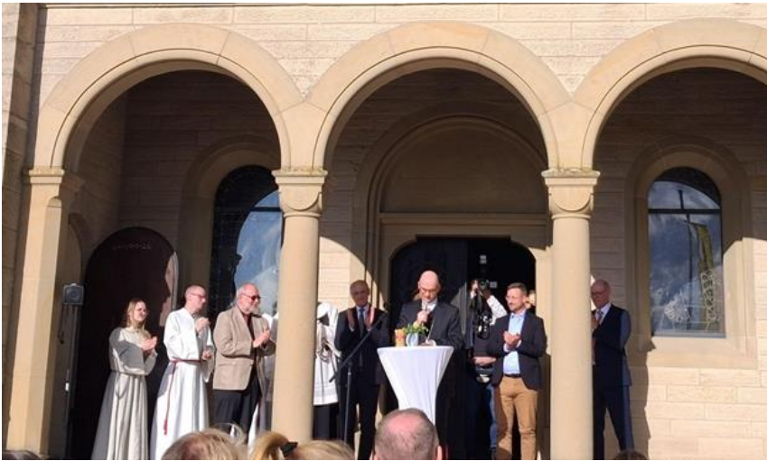
Eröffnungsrede zur Einweihung des Erlebnis-Kreuzwegs am Zeiler Käppele.