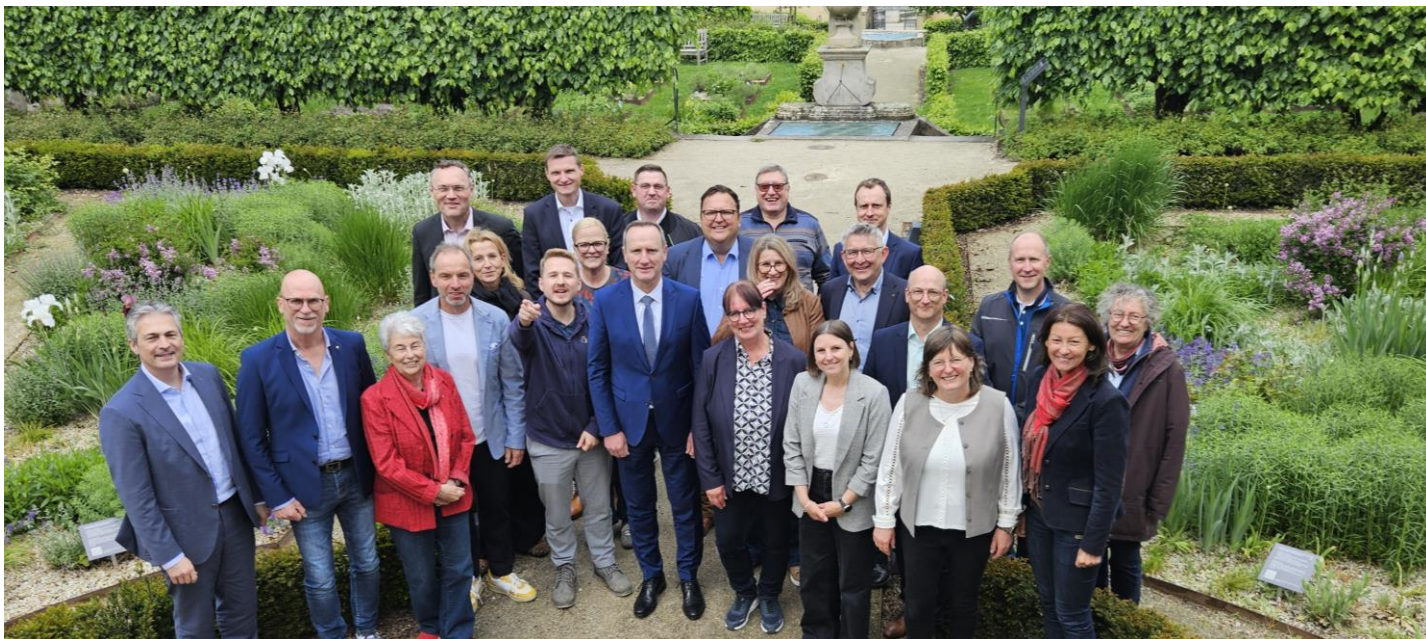
Neugewählte Mitglieder des Steuerkreises, sowie das LAG-Management der LAG Haßberge e.V.