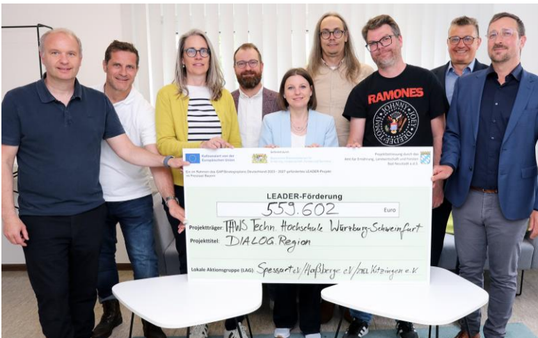
Übergabe des Förderbescheids durch LEADER-Koordinator P. Kläehre (re.) mit allen beteiligten LAGn, TTZ-Leitern und THWS-Vertretern.