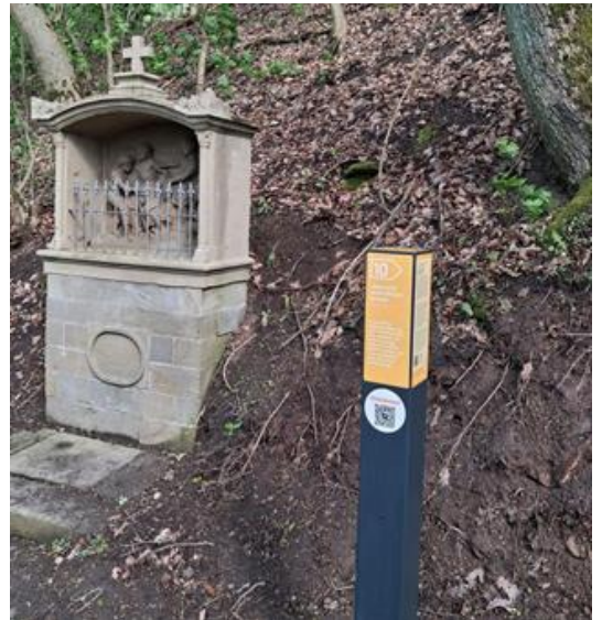
Infostele am Kreuzweg.

Am 19. April 2026 wurde der Erlebnis-Kreuzweg in Zeil a.Main feierlich eingeweiht. Im Rahmen des Projekts wurden die 15 Kreuzwegstationen sowie die Ölberg- und die Kreuzbergkapelle umfassend saniert. Zudem wurde der Kreuzweg, der von Zeil zum Käppele führt, instand gesetzt. Ergänzt wurde das Angebot durch Infostelen, Informationstafeln und Sitzgelegenheiten. Träger des Projekts ist die Stadt Zeil.