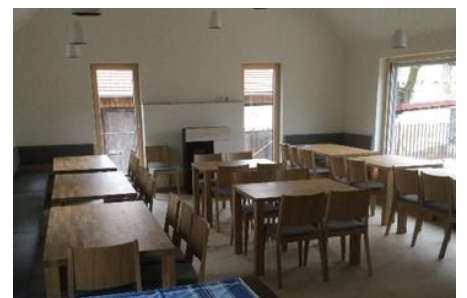
Innenbereich des Dorfgemeinschaftshauses.

Mit einer feierlichen Veranstaltung wurde am 11. April 2026 das Dorfgemeinschaftshaus Rottenstein eröffnet. Das über LEADER geförderte Projekt umfasst die Ausstattung des Innen- und Außenbereichs, die Öffentlichkeitsarbeit sowie die Untersuchung des im Ort